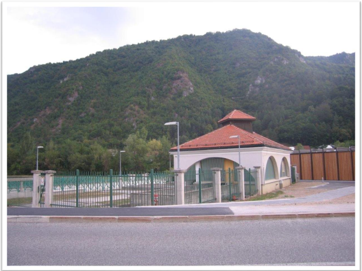
Slika 1: Črpališče fekalnih vod Radeče